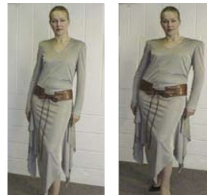
Рис. 1. Вид изделия на манекенщице и на клиенте

Широкие возможности «Грации» позволили поднять на качественно новый уровень выполнение индивидуальных и корпоративных заказов. Подсистема «Индивидуальные и корпоративные заказы» предназначена для создания и ведения базы данных обмеров клиентов, их сортировки и группировки, автоматического перестроения лекал на конкретные фигуры с учетом их размеров и осанки.